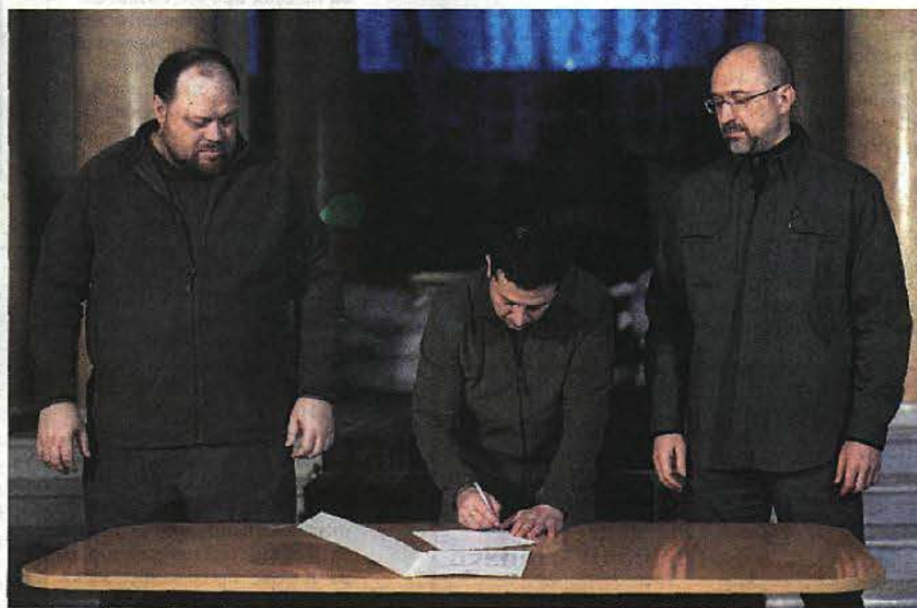
Украинският президент Володимир Зеленски подписва официална молба за присъединяване на Украйна в ЕС в присъствието на премиера Денис Шмигал (вдясно) и говорителя на парламента Руслан Стефанчук (вляво).